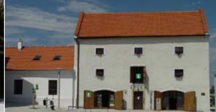
18 - Kulturalne centrum informacyjne, Valasske Mezirici

Oferta zakwaterowania jest u nas bardzo rozmaita. Możecie się zakwaterować w pensjonatach, chatkach czy chałupkach, w domach rodzinnych albo wielkich luksusowych hotelach. W miejscowych karczmach i restauracjach możecie posmakować tradycyjne walaszskie dania.