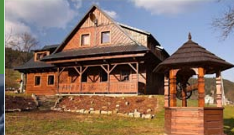
19 - Zakwaterowanie, Velke Karlovice