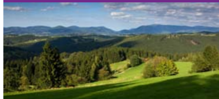
1 - Widok z Valasske Bystrice na Radhost

U nas znajdziecie dziesiątki chronionych zabytków przyrody i rezerwatów, jak np. Galowskie łąki (Huslenky), Poskla (Hutisko – Solanec), Pod Juraskou (Horní Bečva), Uherska (Zdechov), Stribrník (Hovezi), Kutany (Halenkov), Razula (Velké Karlovice), Kudlacena (Horní Bečva) i wiele innych.