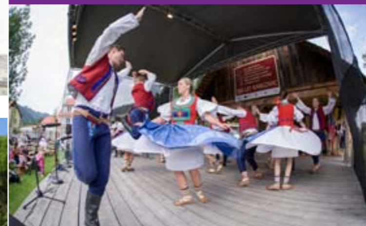
6 - Uroczystości 300 lat Karlovic, Velke Karlovice

Przez cały rok panuje tu żywy kulturalny ruch w postaci tradycyjnych kulturalnych akcji, do których należą jarmarki, odpusty, festiwale, koncerty i wystąpienia, wystawy, wykłady czy też przedstawienia teatralne.