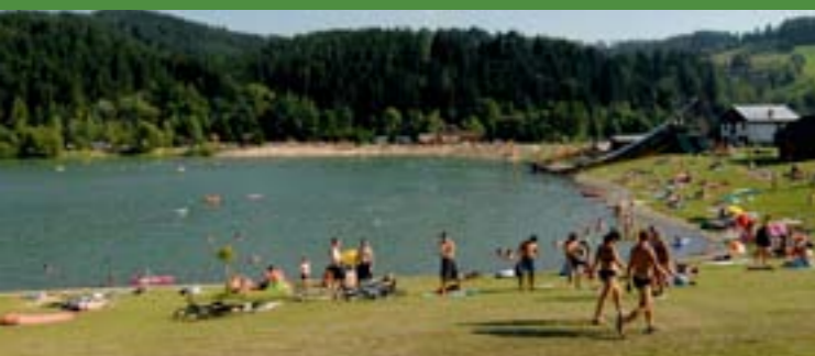
8 - Kąpielisko naturalne, Novy Hrozenkov

Oferta zakwaterowania jest u nas bardzo rozmaita. Możecie się zakwaterować w pensjonatach, chatkach czy chałupkach, w domach rodzinnych albo wielkich luksusowych hotelach. W miejscowych karczmach i restauracjach możecie posmakować tradycyjne walaszskie dania.