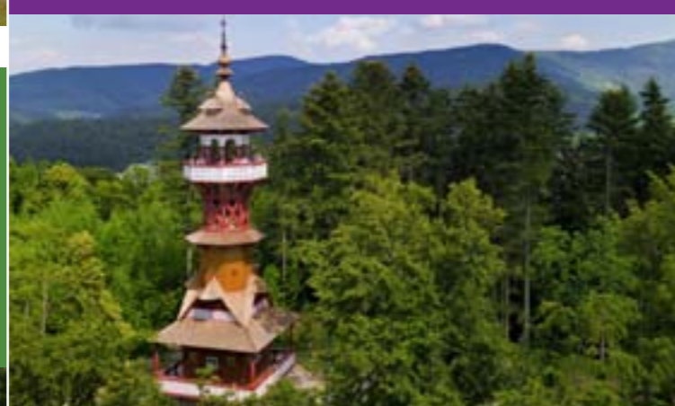
11 - Jurkovicova wieża widokowa, Rožnov pod Radhostem

W sezonie letnim można korzystać z otwartych kąpielisk w miejscowościach Novy Hrozenkov, Zdechov, Velke Karlovice, Vigantice, Hutisko – Solanec, Rožnov pod Radhostem czy też Valasske Mezirici. Do ulubionych należą też śluza przy auto-kempingu w miejscowości Hovezi, zapora Bystricka czy zapora w Górnej Beczwie (Horni Becva).