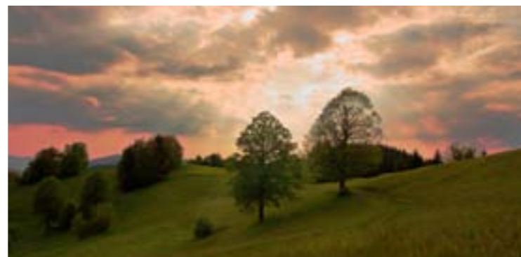
2 - Galowskie łąki, Huslenky