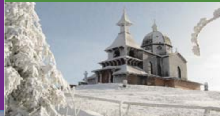
3 - Kaplica św. Cyryla i Metodego, Radhost

Nasz region wyróżnia się bogactwem zabytków kultury, jak również niezliczoną ilością zabytków o znaczeniu lokalnym z elementami tradycyjnej walaszskiej architektury. Wyróżnić tu możemy głównie kościoły, kapliczki, dzwonnice, muzea i nie na końcu także zachowane w dobrym stanie walaszskie drewniane domy tak typowe dla wszystkich miejscowości.