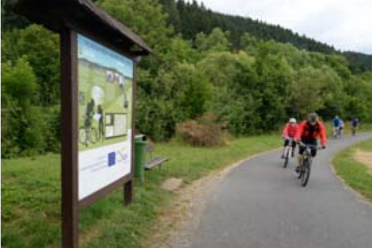
14 - Szlak rowerowy Beczwa, Janova