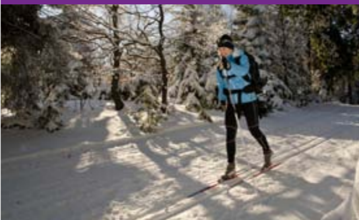
15 - Trasa na biegówki na grzbiecieniu Jaworników

Nie można też pominąć, bardzo ulubionego przez odwiedzających, szlaku rowerowego Beczwa, który biegnie przez doliny Rožnowskiej i Vsetinskiej rzeki Beczwy.