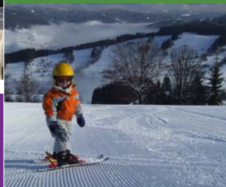
17 - Wyciąg narciarski Vranca, Novy Hrozenkov

Osrodki narciarskie oferują trasy zjazdowe o najróżniejszym stopniu trudności z wyciągami o rozmaitych długościach. Najwięcej z nich znajduje się w Velkich Karlovicach, Novem Hrozenkove, Horni Becve, na Pustevnach i Solani. Mniejsze wyciągi narciarskie znajdziecie także w okolicznych miejscowościach. W narciarskich arealach Pustevny, Raliska i Kohutka są czynne także wyciągi krzeselkowe.