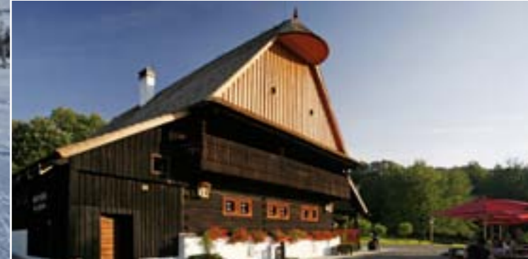
20 - Wójtostwo, Hutisko – Solanec