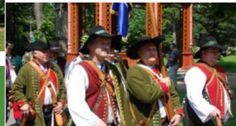
7 - Portaszkie uroczystości, Valasska Bystrice

W siedmiu miejscowościach znajduje się turystyczne centrum informacyjne, są to: Karolinka, Novy Hrozenkov, Velké Karlovice, Zasova, Valasska Bystrice, Rožnov pod Radhoštěm i Valasske Mezirici.