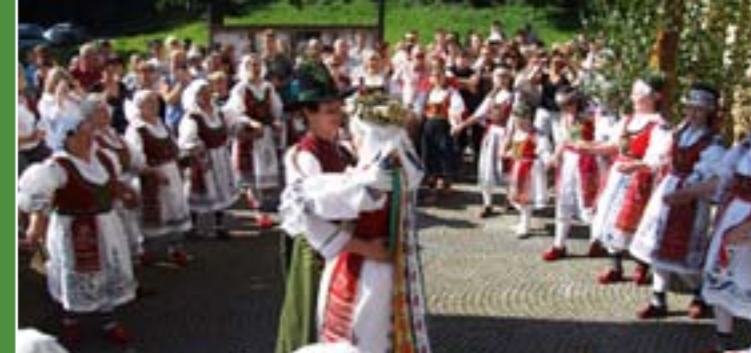
5 - Walaszskie wesele, folklorystyczny zespół Hafera, Novy Hrozenkov

Piękno Walaszka, oryginalność krainy i mieszkańców inspirowała już wielu poetów, pisarzy, malarzy i kompozytorów. Również tutaj działają zespoły pieśni i tańca, które kultywują walaszski folklor.