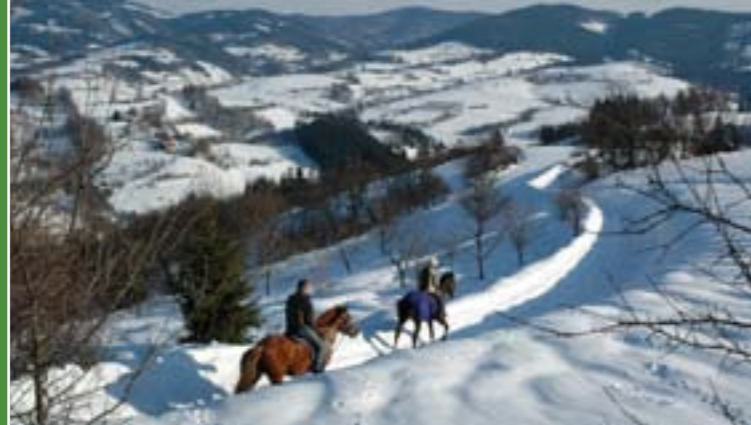
10 - Zimowa przejażdżka przez Walaszsko

Turystyczny obszar „Walaszsko moje” oferuje bardzo dobre warunki dla aktywnego spędzania wolnego czasu. To właśnie wyjątkowo zachowany krajobrazowy charakter z dostateczną i wysokiej jakości infrastrukturą turystycznego ruchu a także osobliwa kultura ludowa przyciągają do Walaszksa najwięcej turystów. Ci jeżdżą tutaj głównie na cykloturystykę i turystykę pieszą, natomiast w zimie na narty zjazdowe czy też biegówki, albo na przechadzki na śnieżnicach.