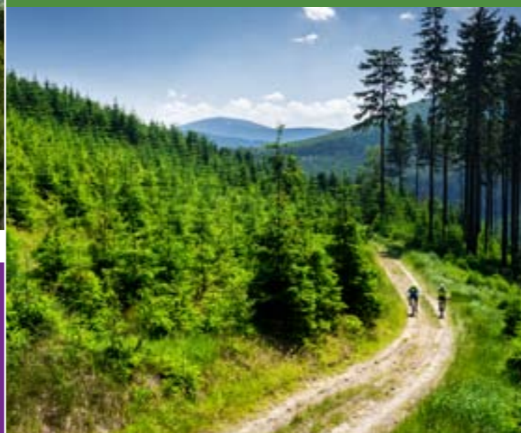
13 - Verovické wierzchołki z Radhostem w dali

Dzięki swej bogato ukształtowanej rzeźbie terenu znajduje się tu gęsta sieć szlaków turystycznych i rowerowych. Do najbardziej znanych należy zwłaszcza obszar Jaworników, Vsetinskich wierzchołków, Verovickich wierzchołków, Pusteven, Radhosta i Solane. Wypróbować możecie także trail/ścieżki dla rowerzystów w Velkich Karlovicach i w Zdechowie.