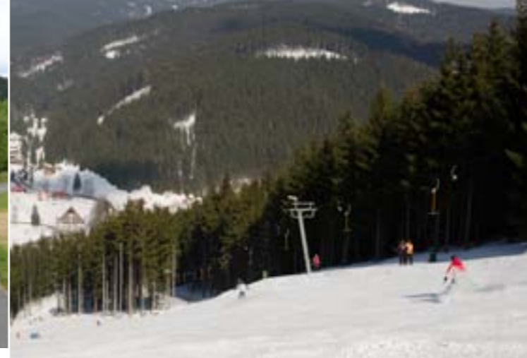
16 - Skiareal Razula, V. Karlovice