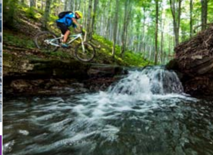
12 - Potok Jiczinka, Verovické wierzchołki